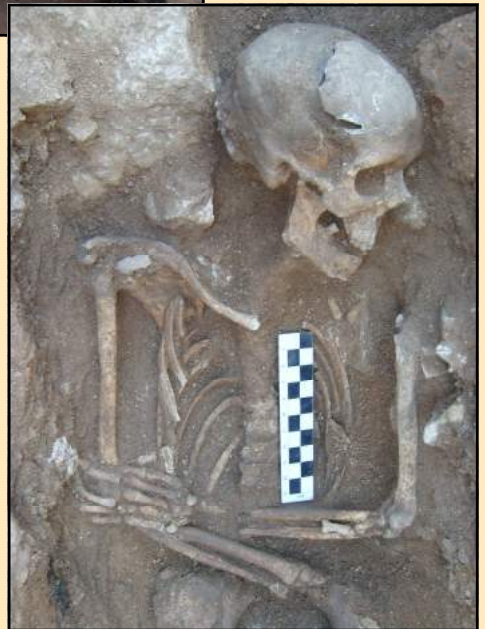
Cementiri Plaça Pompeu Fabra